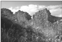
Vista de los restos de la muralla del castillo de Ademuz.

cedió la cuarta parte de sus derechos que le correspondían en la curia de esta población, para que con tal arbitrio pudieran atender mejor los vecinos a las obras de reparación que se hacían en el