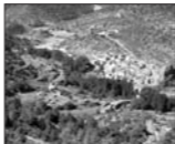
Vista de la población