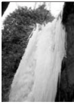
Cascada en Arroyo Cerezo completamente congelada debido a las glaciales temperaturas.

"Bueno es dar cuando nos piden; pero mejor es dar sin que nos pidan, como buenos entendedores". Khalil Gibran.